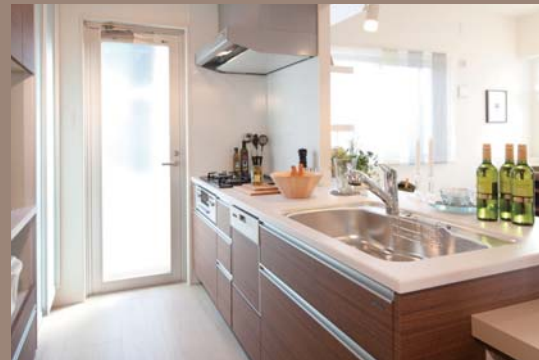
食器洗い乾燥機や高性能コンロ等を装備した先進キッチン