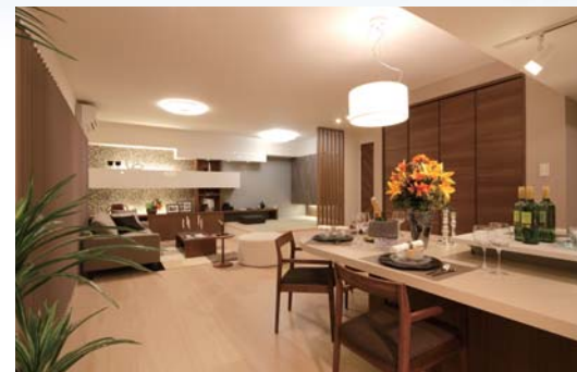
より広く、より明るくプランできるオーダースタイルの暮らし

自分らしい暮らしや憧れの生活スタイルを、とことん追求できる暮らしにご期待ください。