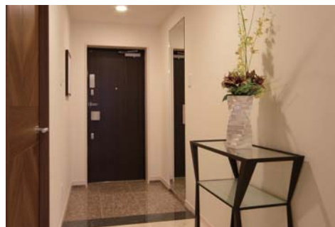
わが家の顔にふさわしい格調高い玄関は、収納も充実