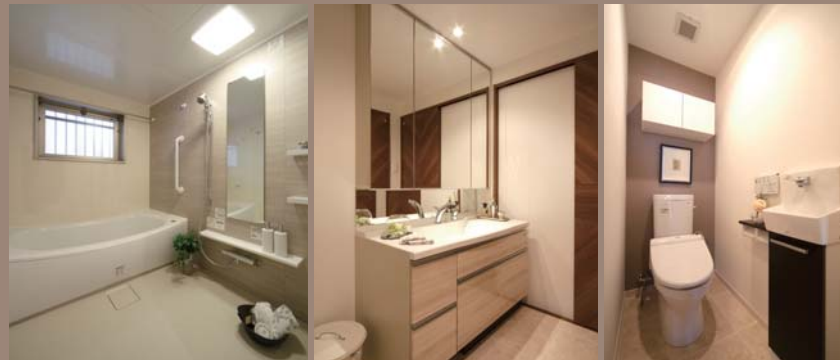
癒しの広々設計と爽やかな換気窓が魅力のバスルーム ウォール一体型カウンター付き洗面化粧台 手洗器が上質感を演出し、エコに役立つ節節水トイレ