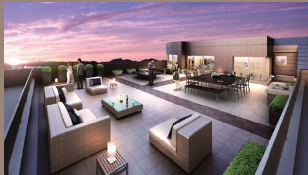
開放感を贅沢に愉しめるルーフバルコニー