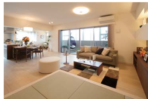
和室と連動し、モダンな雰囲気を愉しめるリビング・ダイニング