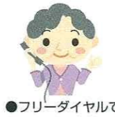
●フリーダイヤルで