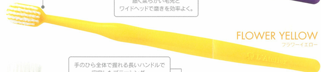
FLOWER YELLOW フラワーイエロー