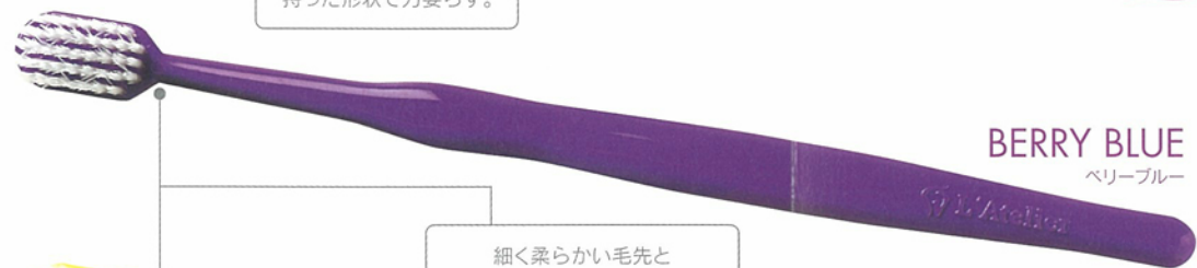
BERRY BLUE ベリーブルー