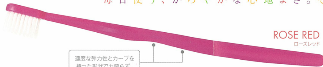
ROSE RED ローズレッド